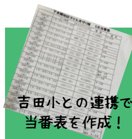
吉田小との連携で当番表を作成！

また、この活動を通じて改めて実感するのは、下本郷地区の団結力の強さです。地域の結びつきがあるからこそ、スムーズに運営できているのだと思います。”