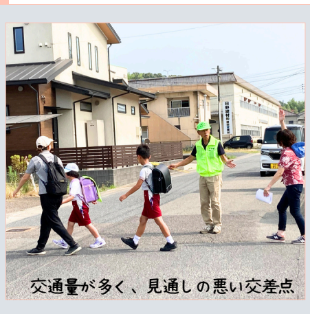
交通量が多く、見通しの悪い交差点

”「下本郷地区子ども見守り隊」は平成18年7月に発足し、今年で19年目を迎えます。