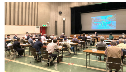
総会開催 令和6年5月11日 益田市民学習センターにて

本年度も住民の皆様と一緒に、元気いっぱいひとがつながるまちづくりを目指して活動したいと思っておりますので、ぜひご参加、ご協力のほどよろしくお願い申し上げます。