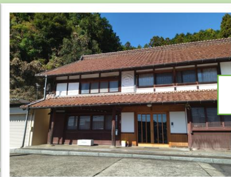
島田家住居・酒蔵