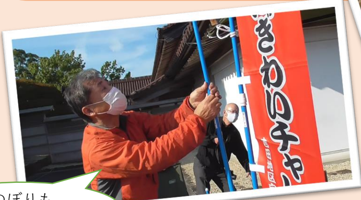
のぼりも 作りました！