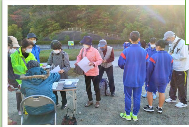
運動公園 スタート！

当日は快晴に恵まれ、史跡・名所では文化財課の職員さんから詳しい説明を聞きました。