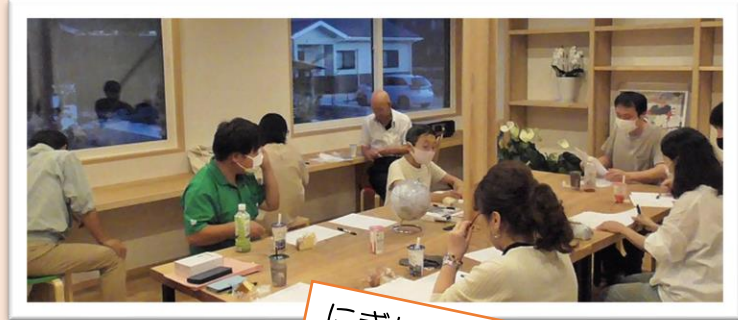
にぎわいを作る人をつくる「わくわくワークショップ」開催！

これからも「にぎわいづくり」の仲間を増やして、吉田地区を盛り上げていきたいと、みんな話しています。