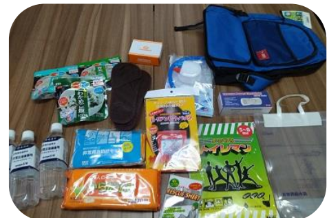
非常用持ち出しセット1セット

※防災訓練などの自治会活動や、青少協での活動に貸し出しをします。 詳しくは事務局までお問い合わせください。