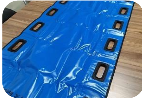
折り畳み式担架1台